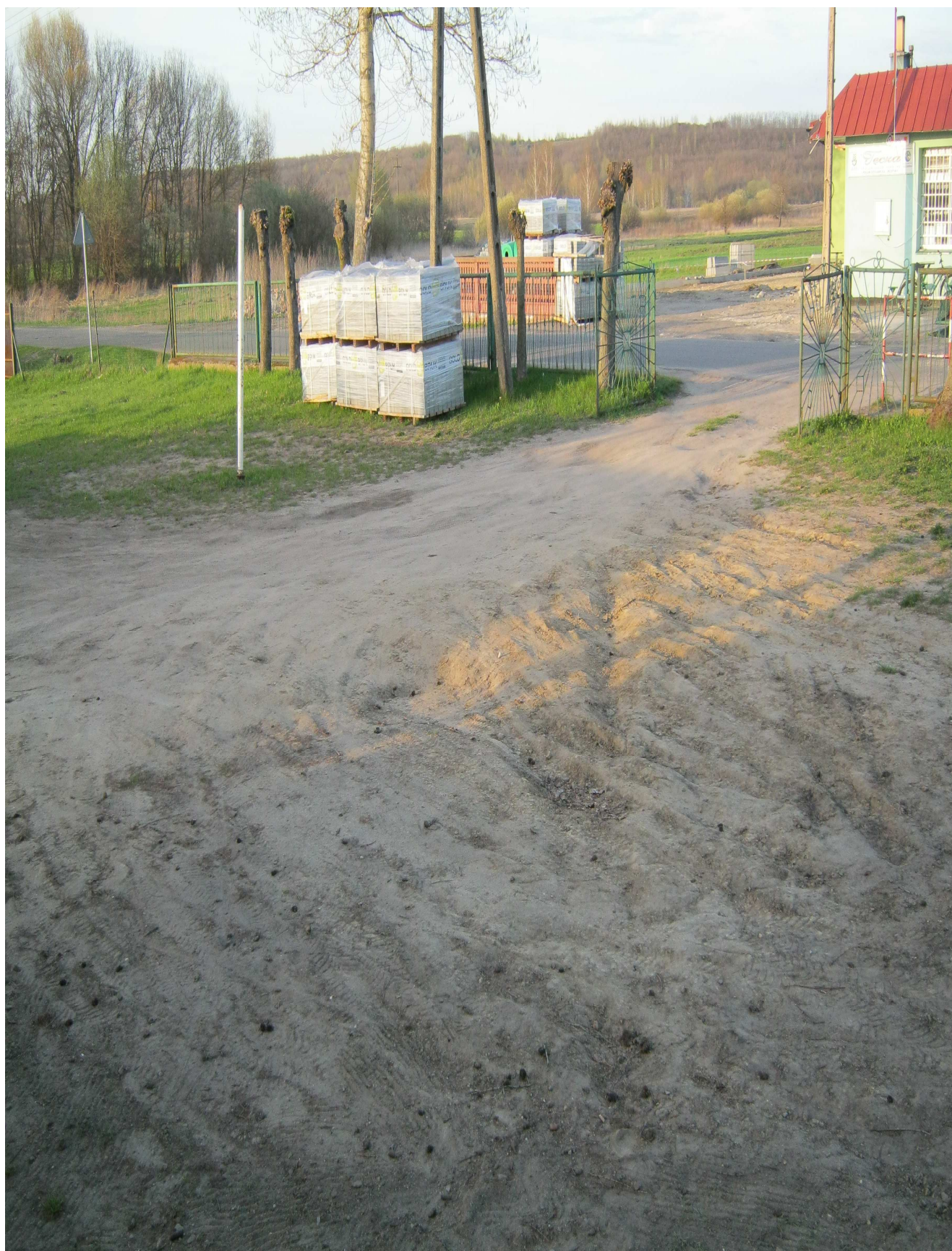
Zdjęcie 5: Teren wymagający położenia nawierzchni z kostki brukowej