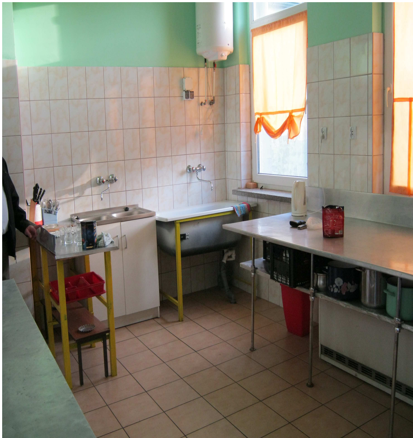
Zdjęcie 1: Kuchnia wymaga doposażenia

Realizowanie poszczególnych zadań dla wsi Pogoń Gosławicka spowoduje :