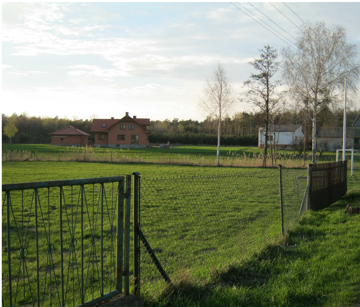
Zdjęcie 10. Miejsce na plac zabaw we wsi Pogoń Gosławicka

Kolejną ważną misją do wypełnienia pozostaje wybudowanie placu zabaw dla dzieci. Przedsięwzięcie ma znaczenie ze względu na kształtowanie obszarów o szczególnym znaczeniu dla zaspokajania potrzeb mieszkańców, sprzyjających nawiązywaniu kontaktów społecznych, ze względu na ich położenie oraz cechy funkcjonalno – przestrzenne. W czasie niżu demograficznego musimy działaniami zachęcać matki do zakładania rodzin wielopokoleniowych. Dzieci mają szansę bezpiecznej zabawy, a mamy czas na wymianę poglądów i doświadczeń na temat swoich pociech. Budowa placu zabaw polegać będzie na uporządkowaniu terenu, wykonaniu trawnika, montażu urządzeń placu zabaw (huśtawek, piaskownicy, zjeżdżalni), ławek, wykonaniu ogrodzenia.