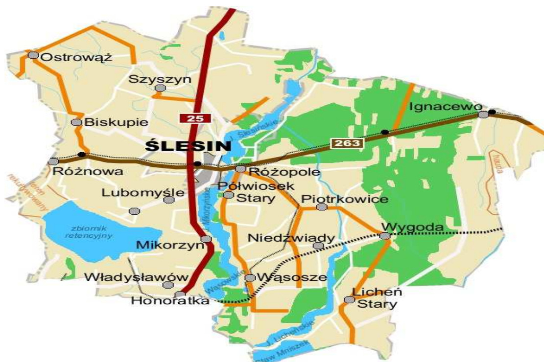
Mapa 2. Gmina Ślesin

Biorąc pod uwagę uwarunkowania geograficzne, przyrodniczo-środowiskowe, historyczne i kulturowe, poziom infrastruktury technicznej, potencjał demograficzny, aktywność społeczną można stwierdzić, że cała gmina, w tym sołectwo Pogoń Gosławicka, posiadają wewnętrzny potencjał i determinację dla rozwoju społeczno-gospodarczego, szczególnie w kierunku turystyki i agroturystyki.