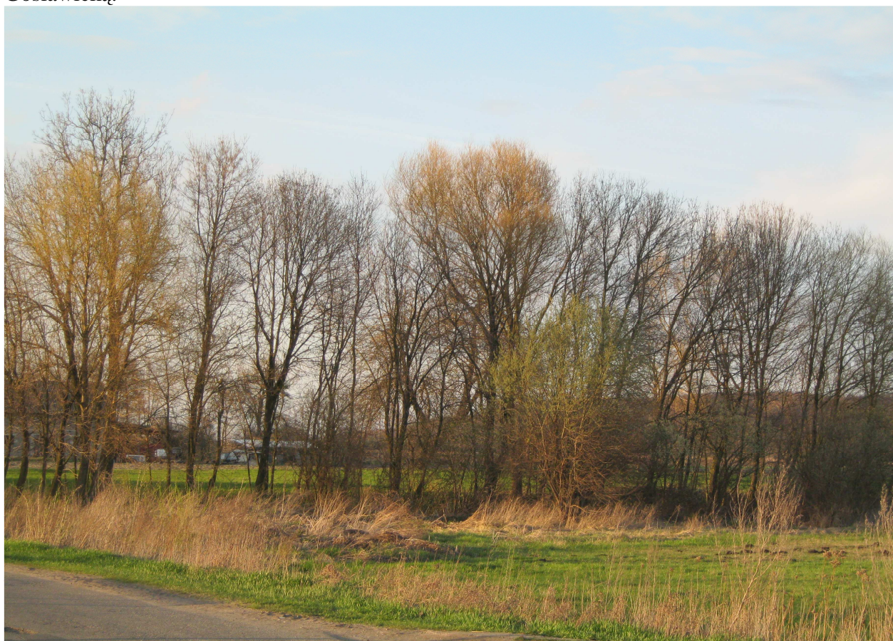
Zdjęcie 2: Tereny Sołectwa Pogoni Gosławickiej