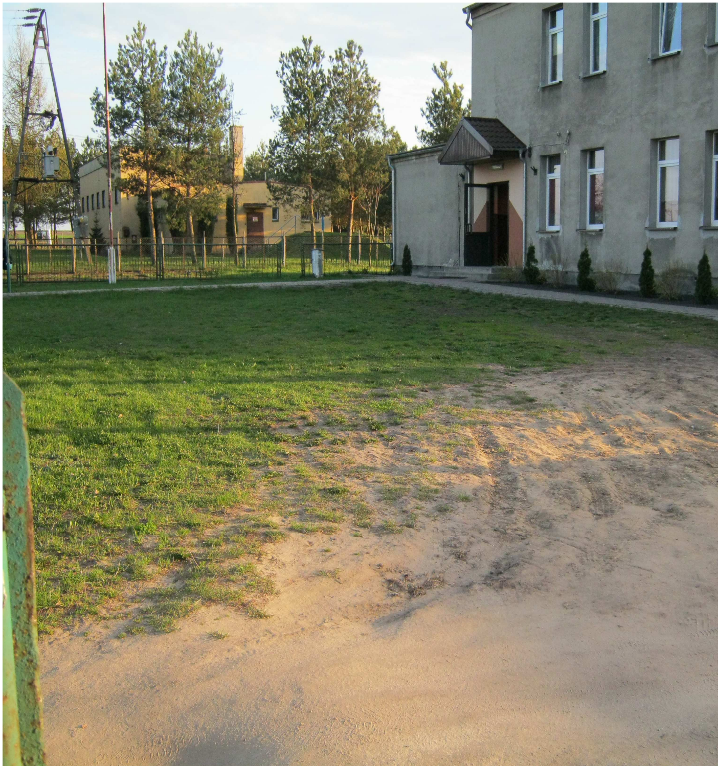
Zdjęcie 4: Utwardzenie powierzchni wokół byłej SP Pogoń Gosławicka

Powstały po utwardzeniu teren będzie spełniał również rolę parkingu.