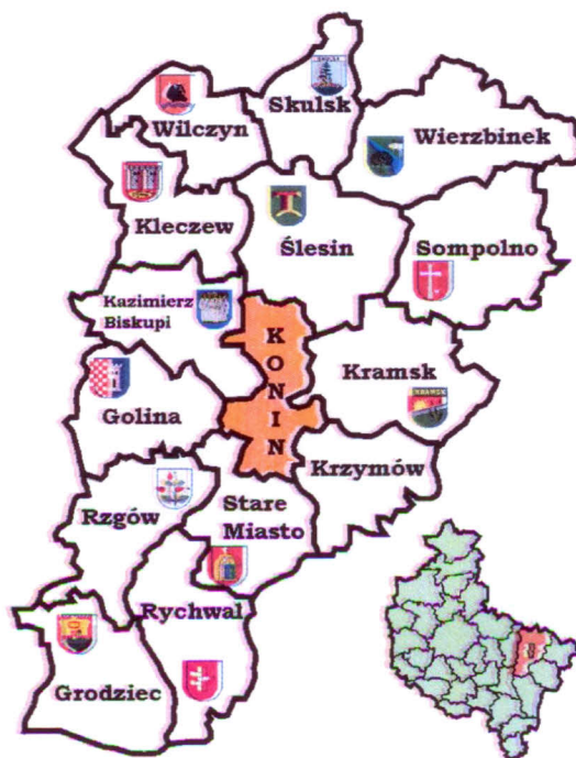
Mapa 1. Powiat koniński

i wraz z powiatem konińskim zaliczana jest do peryferyjnych obszarów wiejskich. Wymaga zatem wielu działań w celu spójnego i zrównoważonego rozwoju gminy, zwiększenia aktywności i integracji społecznej, kształtowania i promowania wizerunku.